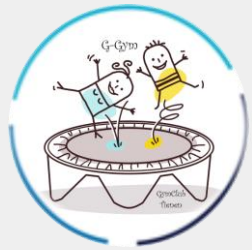
G - GYM

G-Gym richt zich op de motorische ontwikkeling en bewegingspatronen voor kinderen met een verstandelijke beperking (type 2).