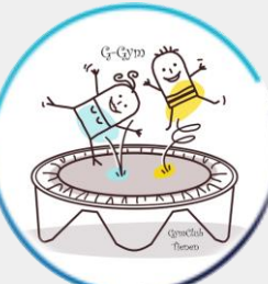
G - GYM